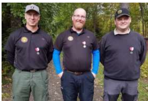
Revolver Öppen klass